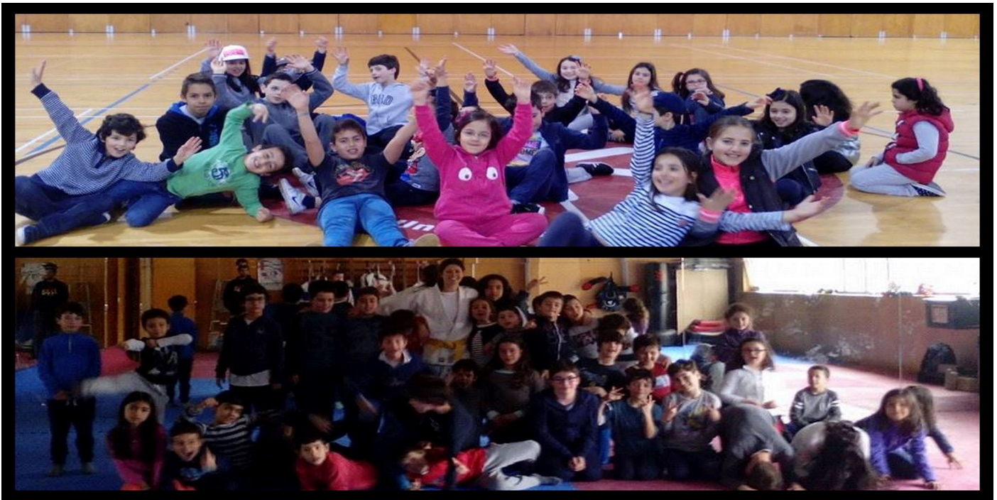
Foto conjunta das crianças participantes