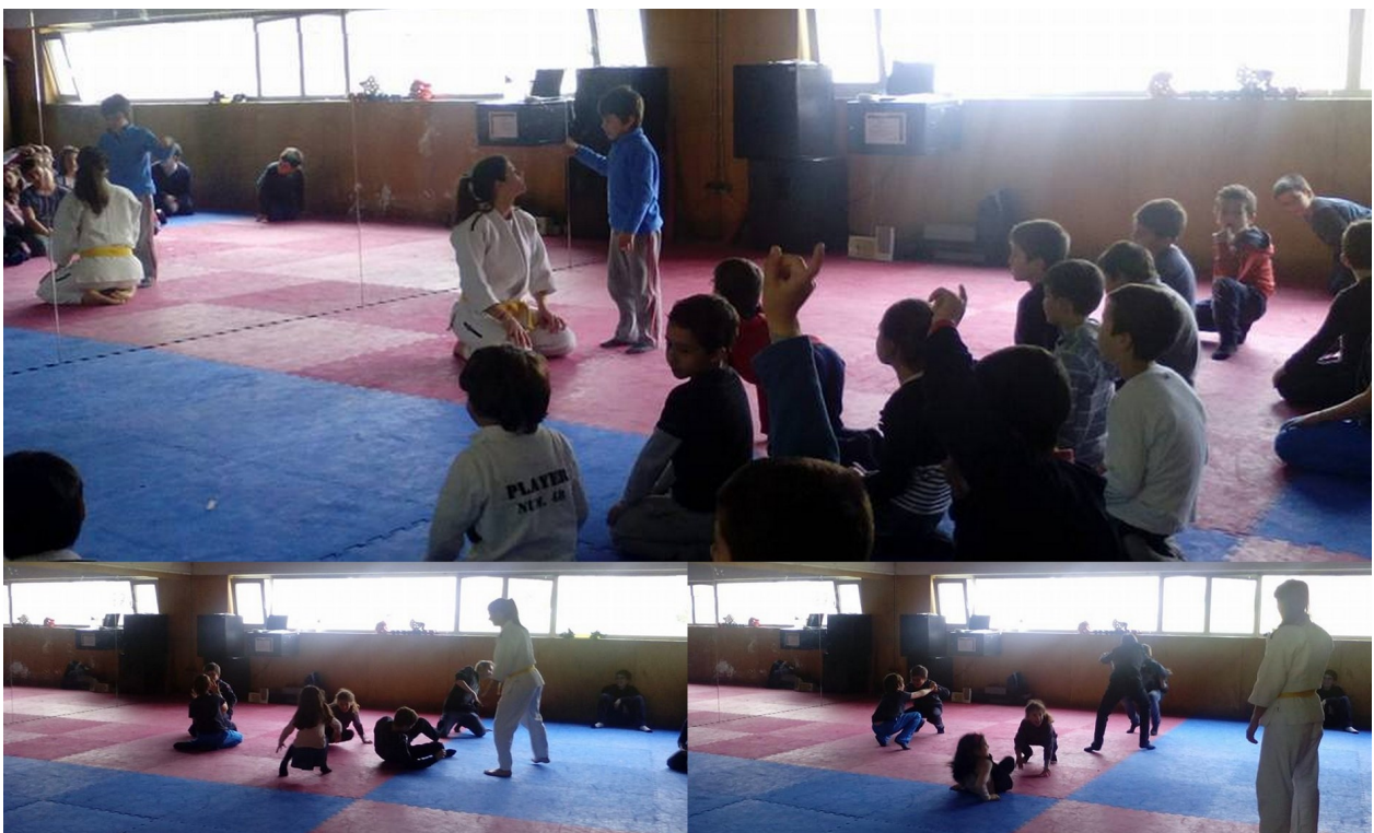
No dia 27 de março, as crianças estiveram a aprender algumas técnicas e movimentos da arte marcial Judo, mostrando-se entusiasmadas e com boa disposição ao longo de toda a atividade.